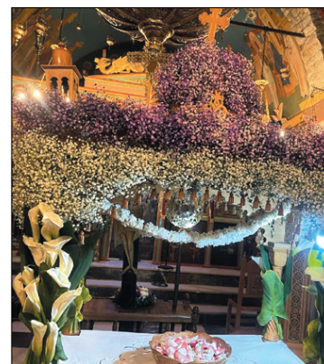
Ο Επιτάφιος της Κανάλας