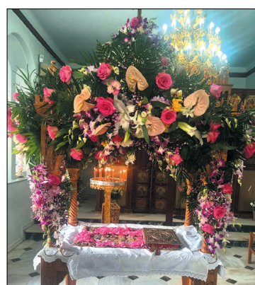
Ο Επιτάφιος του Μέρικα