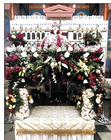
Ο Επιτάφιος της Δρυοπίδας

Όπως κάθε χρόνο με λαμπρότητα γιορτάστηκε και φέτος το Πάσχα στο νησί μας. Πλήθος πιστών παρακολούθησε τις κατασκευαστικές Ακολουθίες τις Μεγάλης Εβδομάδας. Τη Μεγάλη Πέμπτη μετά την Ακολουθία, όπως απαιτεί η παράδοση, οι γυναίκες κάθε οικισμού στόλισαν με μεράκι τους Επιταφίους.